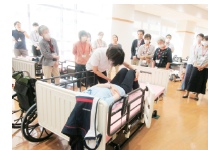
昨年の「高齢者を理解しよう」の様子