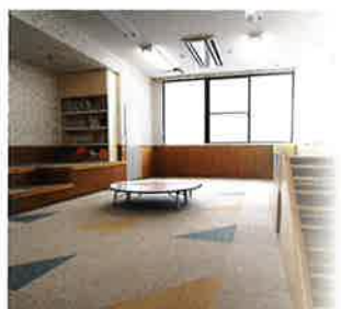
乳幼児用プレイルーム