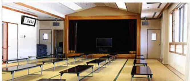
大広間 | 辛夷の間 |