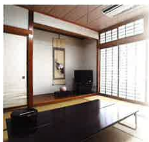
個室 | 薊・萩・山吹・藤 |