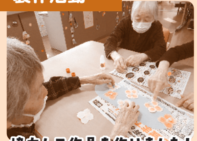
協力して作品を作りました!