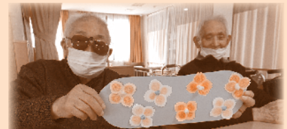
デイサービスで お花がたくさん咲きました。