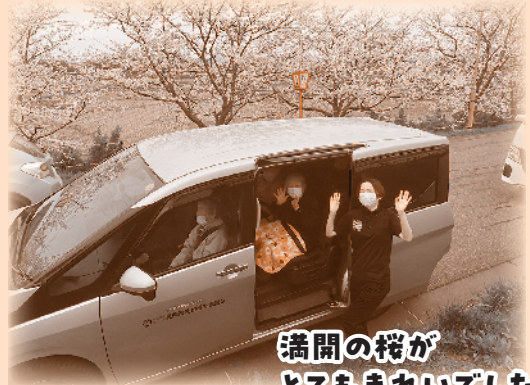
満開の桜が とてもきれいでした!