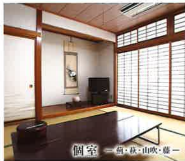
個室 ー 鶴・秋・山吹・藤