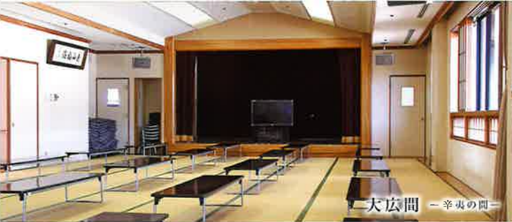
大広間 ー 辛夷の間