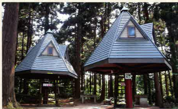
うまみち森林公園 パンガローハウス