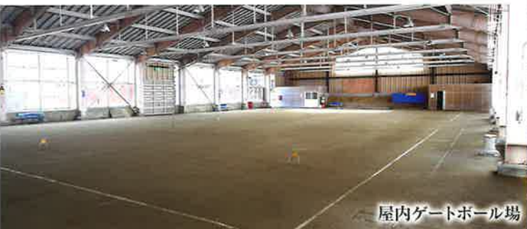
屋内ゲートボール場