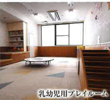
乳幼児用プレイルーム