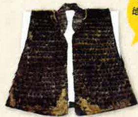
金小札浅葱糸威 二枚胴具足(複製品)