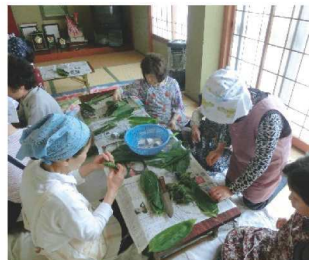
みんなと一緒にちまきづくり

外出の機会が少ない高齢者や子育て中の親などが集い、生きがいづくりの場を提供する身近なお茶の間活動です。 お茶会や健康相談、体操、レクリエーションなどを行い、健康維持につながっています。