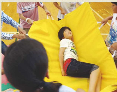
楽しいね!ふわふわマット遊び

二回目は、青葉台小児童がグループごとに楽しめる遊びを計画し、当校児童に進んで声を掛け、笑顔で関わってくれたので、安心して遊ぶ姿が見られました。