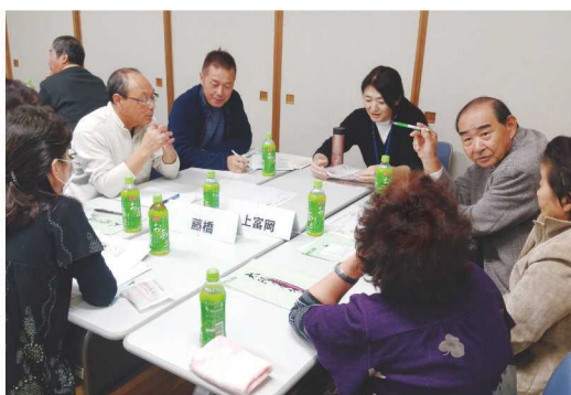
深才地区の懇談の様子

また、地域の福祉サービスや市の見守りシステム、社協事業の説明を受け、自分が利用する立場になった際の相談先や、利用できるサービスについて確認しました。