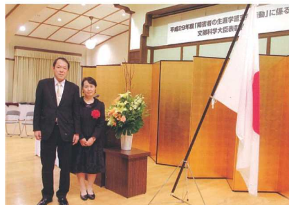
共に活動をされているご主人と表彰式にて

ボランティア大学受講をきっかけに、ボランティア活動を始められました。18年にわたり、視覚障害のある方でもできる音声パソコンを勉強する「パソコン・ココの会」、身体障害のある方の水泳補助「スイム・リーダー愛」での活動を続けておられます。その他にも障害のある方のデイサービスで音声パソコンの学習補助活動もされています。