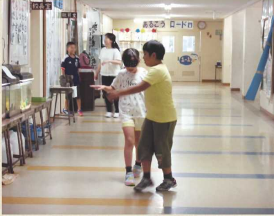
アイマスクを着用した疑似体験

四年生は、国語の学習に関連して目の不自由な人と点字について学びました。また、耳の不自由な人や高齢者についても疑似体験や資料で学びました。自分たちに何ができるのかを考え、活動につなげたいと考えています。