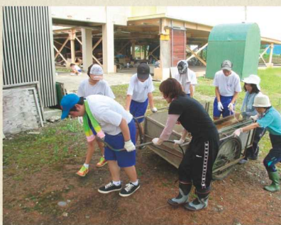
活動部の1日地域貢献活動

今後も地域の思いに応えるとともに、生徒の社会性や人間性を磨く活動をしていきます。