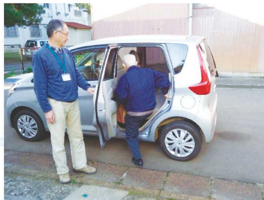
実際の活動の様子