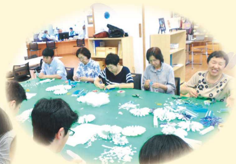
交流スペースに季節の飾りつけを しているボランティアのみなさん