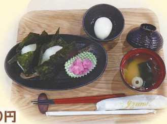
おむすびセット 400円