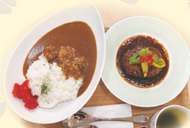
ハンバーグカレーセット 600円