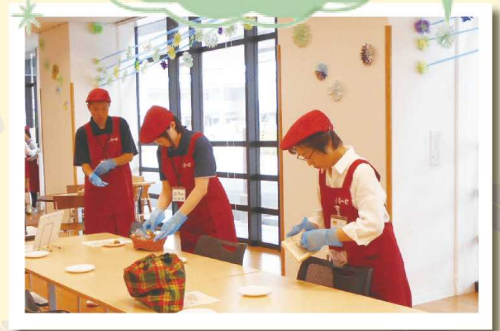
ボランティアさん