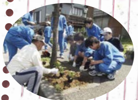
地域の方と一緒に

「どうしたらもう少しボランティアに関心が高まるか」が学校の課題でした。昨年度まではボランティア活動に参加する生徒が少なかったからです。そこで、生徒会総務と青少年赤十字委員会などが中心となり、「一人一ボランティア運動」を企画しました。自分たちでできる活動リストを作成し、一つ以上選択して参加するものです。