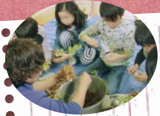
地元のツツジで苔玉作り

大積小学校は、いつも花でいっぱいです。子どもたちがレイアウトを決めた花壇に「親子花壇活動」で花を植えます。登校すると花壇に向かい、花の成長を楽しみながらお世話をします。土日の水やりは保護者のボランティアが活躍します。草取りは地域のお年寄りと一緒にいき、お礼に肩もみをして交流を深めています。