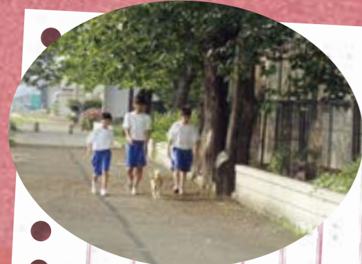
横山けやき苑での犬の散歩

長岡花火の翌日の花火清掃ボランティアでは、二日間、延べ約五百人の生徒が参加しました。この活動は、江陽中学校の伝統となっています。緑の募金や赤い羽根共同募金活動では、毎朝、委員が玄関に立ち、多くの生徒が協力することができました。