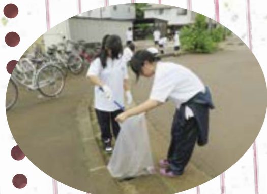
宮内駅周辺のゴミ拾い

今年、地域や保護者より多くの缶やプルタブをご提供いただき、絆がより強固になっていくのを感じております。植物栽培では草花に加え、野菜や果実栽培にも力を入れました。植物の成長に触れた生徒たちの表情にも柔らかさを感じます。今後以上の活動を継続し、生徒たちの思いやりの《心》を育んでいこうと考えられています。