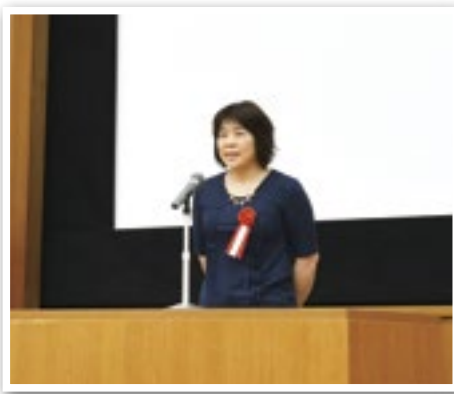
「施設の車両整備に活用し、作業の効率化を図ります。」—活動紹介の様子：あゆみの舎—