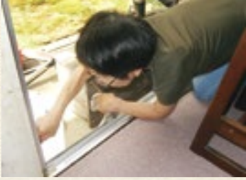
—アルミサッシのレールを掃除— 細かいところまで丁寧にしています

今後、各地区で活発に展開されていくことが期待されているサービスだけに、川崎地区での日頃からの熱心な取り組みや地域づくりにますます期待が高まります。