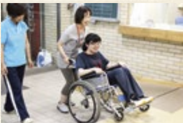
—車椅子体験— 乗る側、押す側、ともにちょっと怖いですが