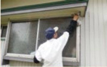
—家の窓ガラス拭き— 普段、自分ではできない箇所の掃除の依頼が多くあります