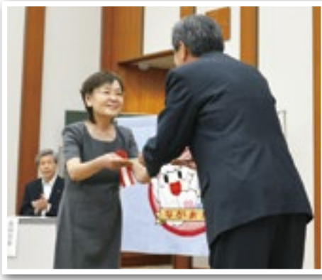
「皆様の善意、大切に活用します」 —目録贈呈の様子：えくぼクラブ—

その後、助成を受ける団体の代表から、助成金を活用して行う活動を紹介していただきました。