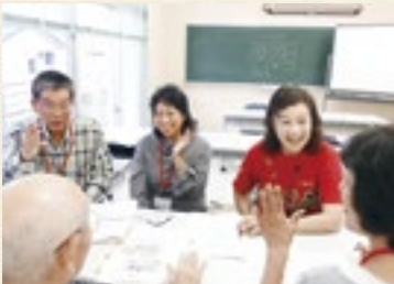
—オリエンテーション— 講座開始後、しだいに笑顔がこぼれます

本講座修了者のボランティアデビューへのつながりも見えるなど成果を上げています。社会福祉協議会、関係機関等が連携して地域でのボランティア活動の推進に努めます。