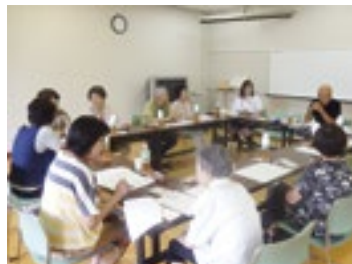
【上川西地区の意見交換会の様子】

また、中越地震の時も迅速な安否確認に効果を発揮したこと、今後いつ来るかわからない災害時にも役立ち、災害に強い地域づくりにもつながっていくことが期待されます。