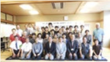
—最後にみんなで記念撮影— 参加者全員で1万食調理の達成を喜びました