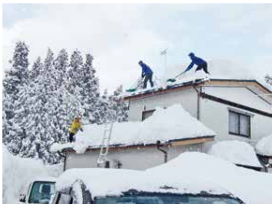
助成団体【かわぐち遊雪隊】の除雪風景