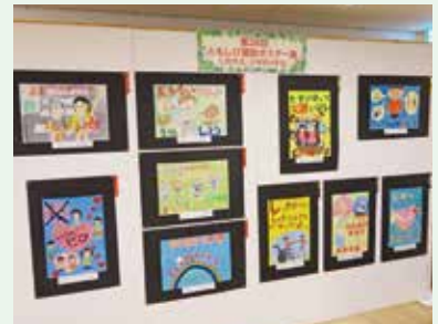
ともしび運動を啓発する すこやかともしびまつり2015 ポスター展の作品