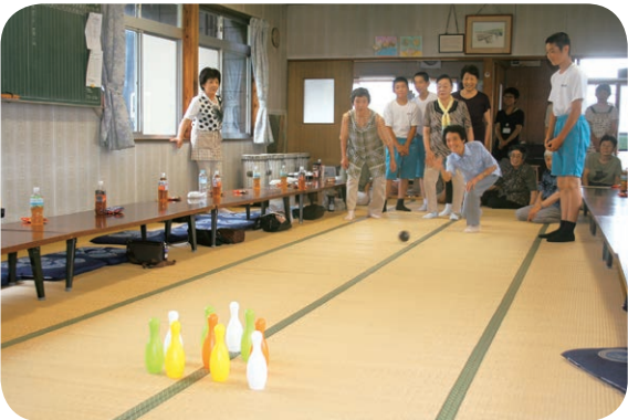
和島地域で行われているサロンの様子