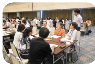
福祉コミュニティ推進の集い