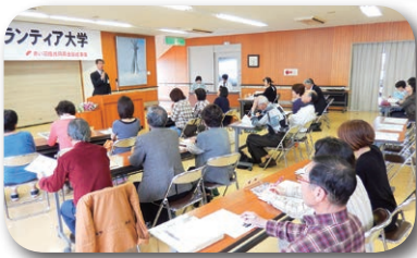
基礎講座 講義風景