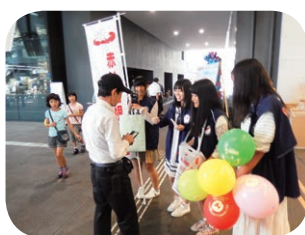
赤い羽根街頭募金