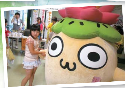
なかのんが お出迎え