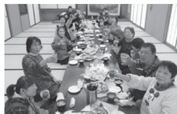
親子調理実習 ビザパーティー

手をつなぐ育成会の力になりたい!ボランティアをしたくても時間が無いという方は、賛助会員という形で、中之島班の応援よろしく申し上げます!