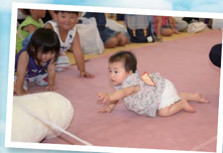
赤ちゃん ハイハイレース