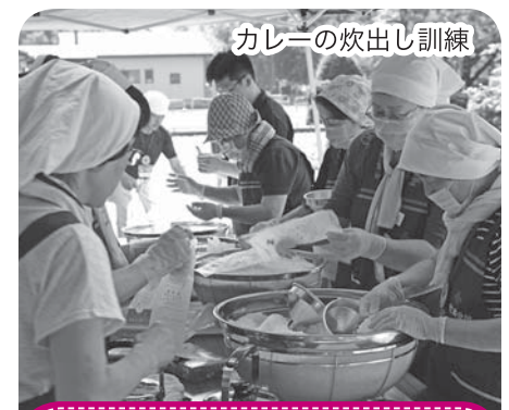
カレーの炊出し訓練