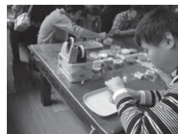
野外体験教室 キャンドル作り