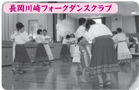
長岡川崎フォークダンスクラブ