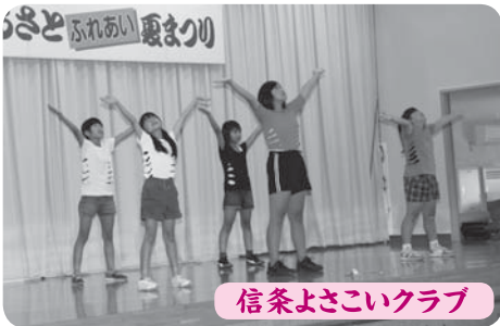
信条よさこいクラブ