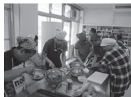
調理実習 カレーライス作り