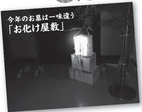
今年のお墓は一味違う「お化け屋敷」