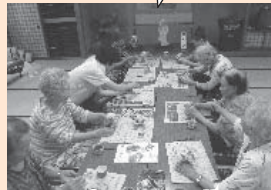
カップフラワー作り