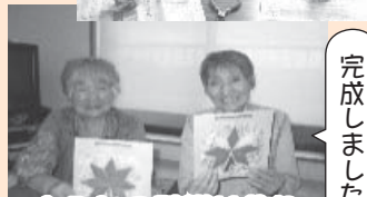
もみじの壁掛け飾り