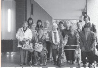
栃尾美術館に行ってきました