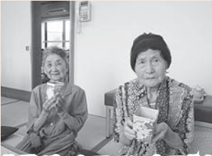
牛乳パックでペン立て作り