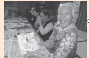
もみじの壁掛け飾り