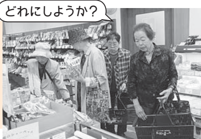
三条市のただいまーとへ