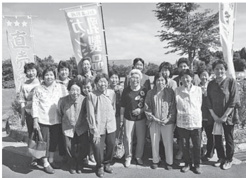
▶和島の道の駅でひと休み… ▶全員集合!はいチーズ…

上沼いきいきサロンは、年6回地域のセンターを会場に活動しています。周りを見渡せば田園風景が広がっています。そのせいか皆さんとてもおおらかで明るく笑いの絶えないサロンです。今回は志保の里荘で1日のんびりしてきたので、明日からまた畑がんばるぞ!!