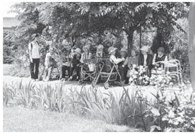
ちょっと休んで水分とりましょうか

気候の良い時期に利用者様に喜んでいただけたらと思い、6月15日、16日に見附市の「イングリッシュガーデン」と三条市の「ただいまーと」へお出かけしてきました。