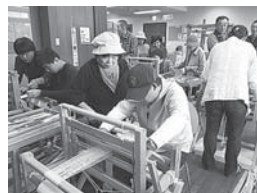
野外教室…機織り体験しました。