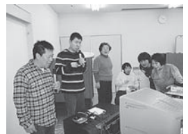
新年会…みんなカラオケ大好き！