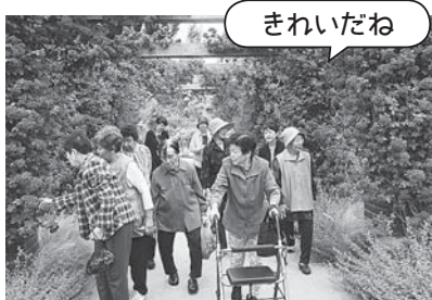
雨が降らないようだったので イングリッシュガーデンにも行ってきました