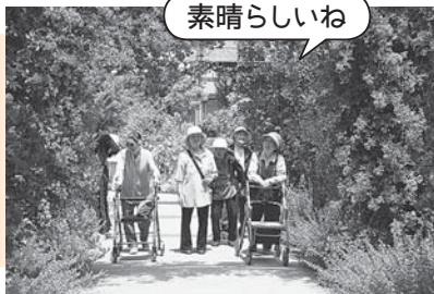
お天気に恵まれました