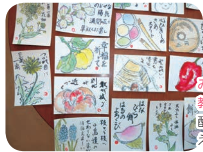
みしま絵手紙教室の会 配食弁当に添えた絵手紙