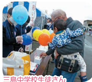
三島中学校生徒さん 令和2年度みしま産業まつりイベント募金活動