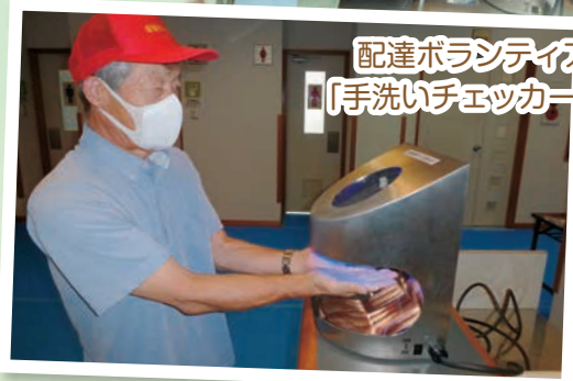
配達ボランティアも、「手洗いチェッカー」体験