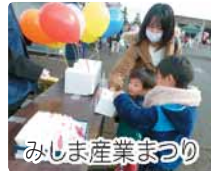
みしま産業まつり