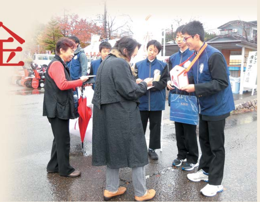
三島中学校生徒によるイベント募金活動の様子